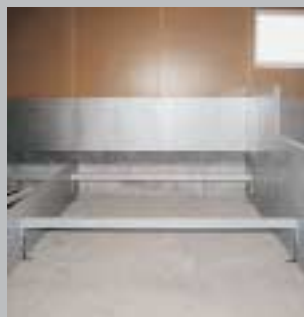
2. På stigulvniveau monteres bæringer på tværs mellem væggene eller støttes evt. på kanalbund.