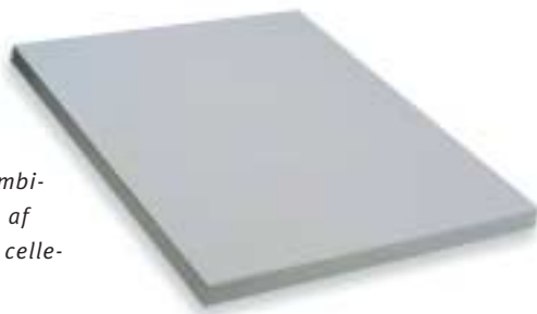
Ikadan Multiflex combi-skallerum opbygges af de stærke Multiflex celleplader