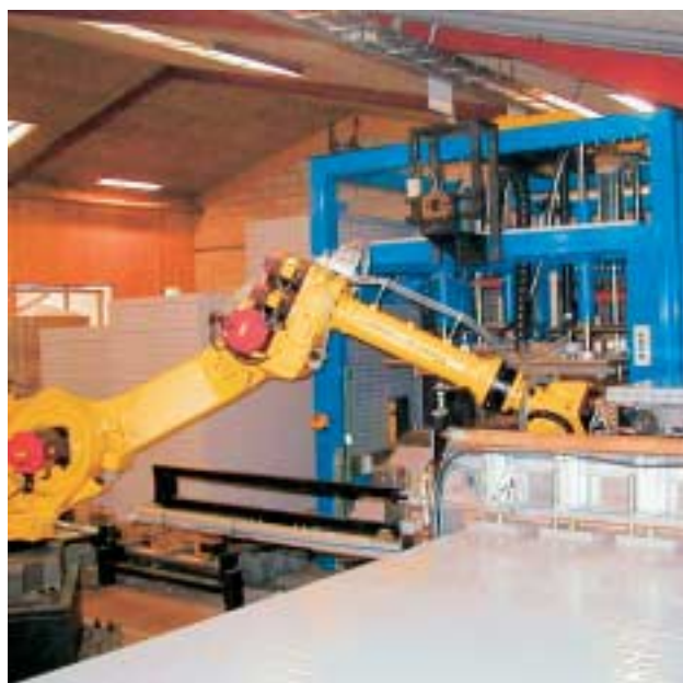
Multiflex celleplader produceres på fuldautomatisk produktionsanlæg på Ikadans egen fabrik.