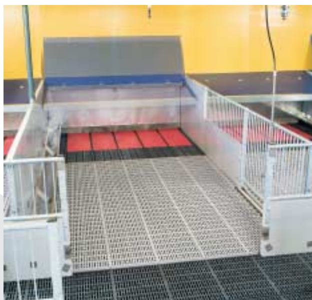
Med Ikadan Multiflex celleplader opnåes en stærk selvbærende væg, der reducerer brug af stolper og samlebeslag. Multiflex celleplader kan benyttes i fuld højde eller i kombination med åbent inventar.

Ikadan Multiflex celleplader fås i mål der passer til de gængse stisystemer.