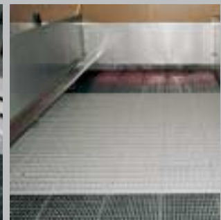
4. Varmeplader, gulvplader og riste monteres.