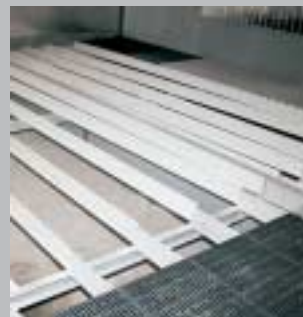
3. På bæringerne monteres understøtninger til stigulvet.