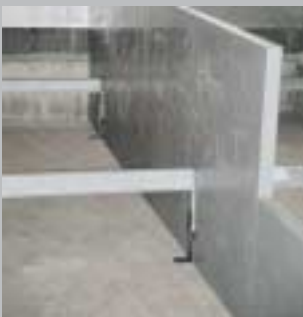
1. Multiflex cellepladerne monteres med beslag på kanalbunden.